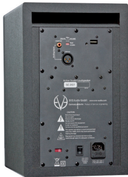
Fig. 1 - Le connessioni posteriori e gli switch per il controllo dei filtri e del volume