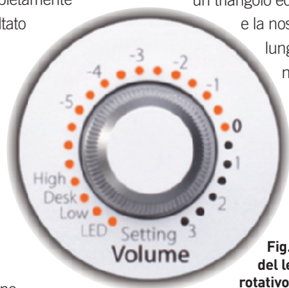
Fig. 3 - La disposizione del led sull'encoder rotativo frontale

L'esperienza di Roland Stenz è stata infusa con successo nei nuovi prodotti Eve Audio ed il modello SC 207 risulta essere adatto tanto in fase di produzione quanto in quella di mixaggio, offrendo un ascolto analitico di alto profilo, dove un mix bello suonerà bene ed uno brutto suonerà male, senza troppi complimenti: una monitor caldamente consigliato che non farà rimpiangere la costola da cui è nata.